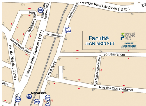
Plan de la Faculté Jean Monnet – Salle Vedel (bâtiment G)

RER B, Station Robinson, descendre l'avenue de la Gare, puis prendre à droite, boulevard Desgranges.