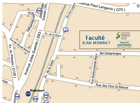
Plan de la Faculté Jean Monnet – Salle Vedel (bâtiment G)

RER B, Station Robinson, descendre l'avenue de la Gare, puis prendre à droite, boulevard Desgranges.